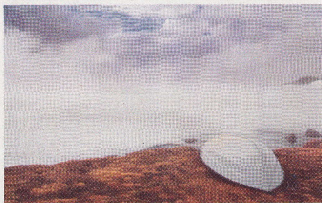
Obloha nad zamrznutým jazerom