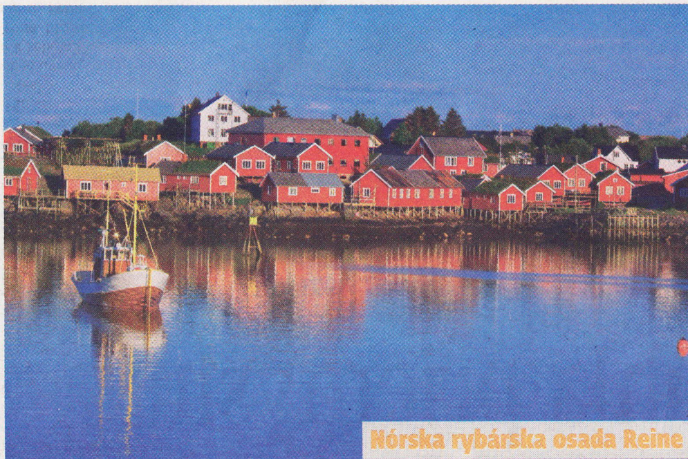
Nórska rybárska osada Reine