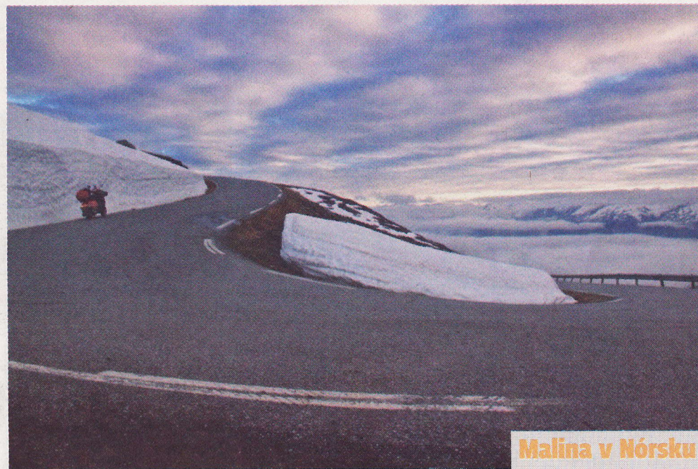
Malina v Nórsku