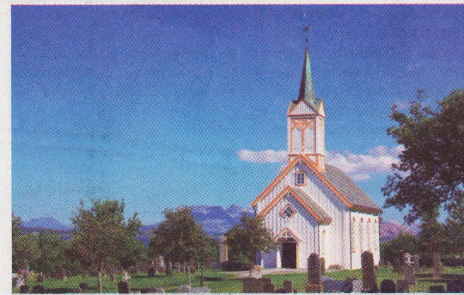
Nórsky kostol vo Forviku